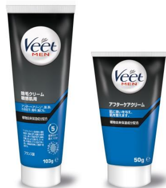
医薬部外品 販売名: ヴィート 除毛クリーム PBS-m 化粧品 販売名: ヴィート クリーム R